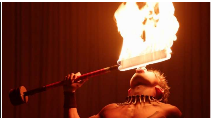
【通常のカメラで撮影した映像】

【本件に関するお問い合わせ先】 常磐興産株式会社 スパリゾートハワイアンズ 広報担当 高橋、國井、高畠